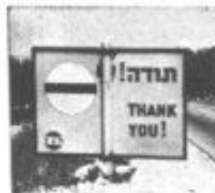
A traffic sign in Israel

"End of construction zone. Resume legal speed."